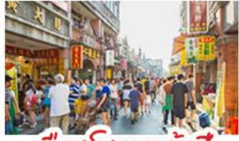
เมืองโบราณต้าชี่

ล่องแพไม้ไผ่ชมแม่น้ำหลี่เจียง - ทุ่งวงช้าง กำลุ่ม้อ - เมืองโบราณต้าชี่ เจดีย์เงินเจดีย์ทอง ซอปปั้งถนนคนเดิน - ถนนชี่เซียง - ถนนชี่เจียง เมมูพิศข บูฟฟี่ต่าบูชี่ฟู้ด ปลายอบเบียร์ สุกี่ที้ด