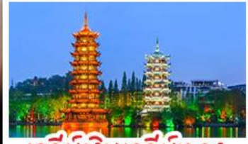
เจดีย์เงินเจดีย์ทอง