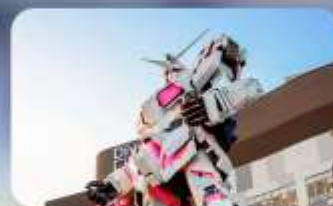
ช้อปปิงโอไดบะ