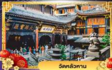
วัดหลัวหนาน