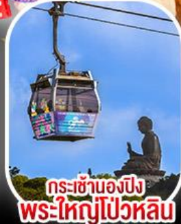
กระเช้าเองปีง พระใหญ่ไผ่หลิน