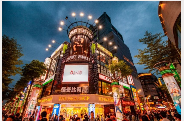
ตลาดกลางคืนซีเหมินติง (Ximending Night Market)

เย็น อิสระอาหารเย็นตามอัธยาศัย ณ ตลาดกลางคืนซีเหมินติง