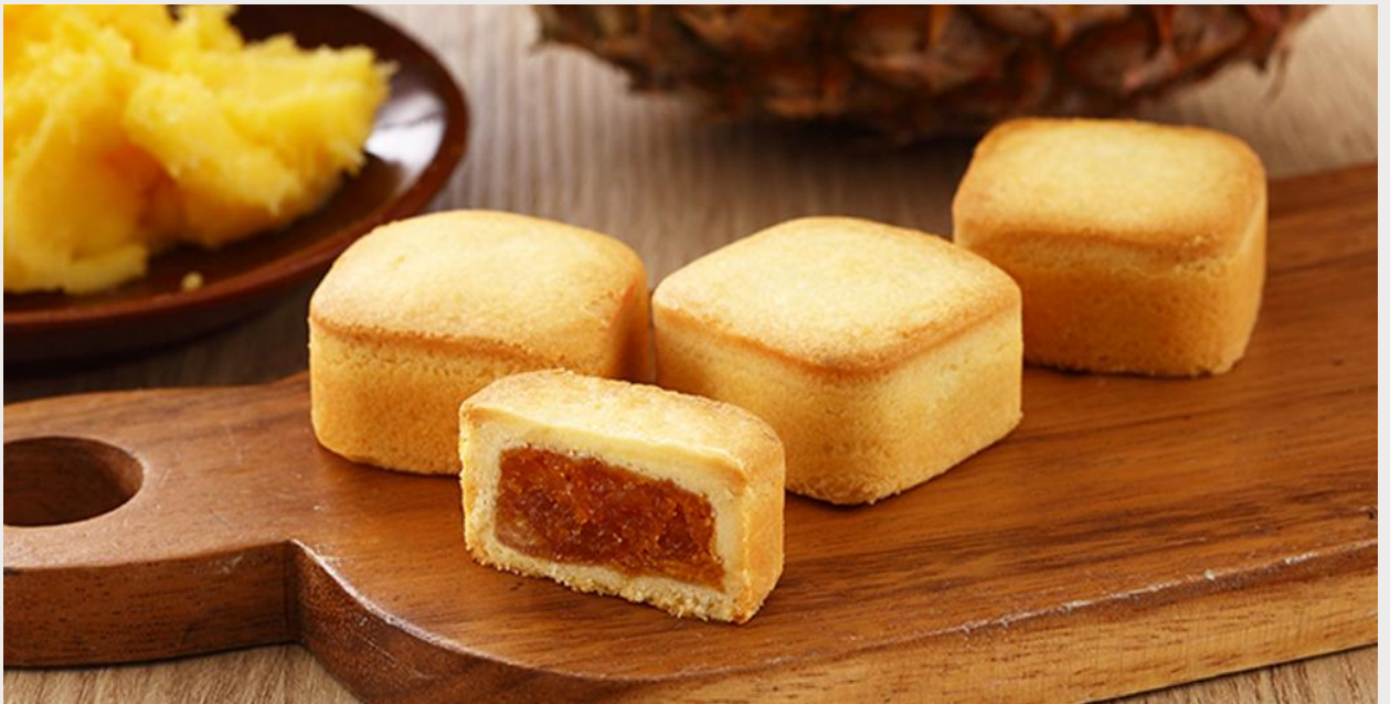
ร้านขนมพายสับปะรด (Taiwanese Pineapple Cake)

นำทุกท่านแวะชิม ร้านขนมพายสับปะรด (Taiwanese Pineapple Cake) ขนมที่ถือได้ว่ามีแหล่งกำเนิดมาจากเกาะไต้หวัน เนื้อแป้งหอมเนยห่อหุ้มแยมสับปะรด รสชาติมีความหวาน และความมันของเนยเล็กน้อย ผสมกับรสเปรี้ยวของสับปะรด ทำให้มีรสชาติที่กลมกล่อมจนเป็นที่นิยม ด้วยรสชาติที่เป็นเอกลักษณ์ไม่เหมือนใคร ทำให้ขนมพายสับปะรดเป็นขนมที่ขึ้นชื่อของเกาะไต้หวัน ไม่ว่าจะใครที่ได้มาเยือนก็ต้องซื้อเป็นของฝากติดมือกลับบ้าน นอกจากขนมพายสับปะรดแล้ว ยังมีขนมอีกมากมายให้เลือกชิม และเลือกซื้อ เช่น ขนมพระอาทิตย์ ขนมพายเผือก เป็นต้น อีสาระให้ทุกท่านเดินเลือกซื้อขนม