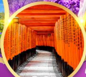
ศาลเจ้าฟุชิมิอินาริ