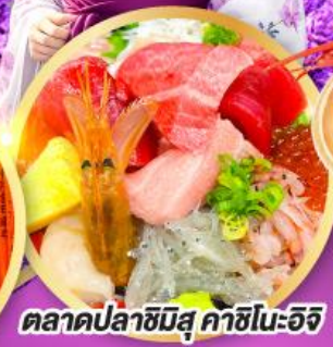
ตลาดปลาซิมิสึ คาชิโนะอิจิ