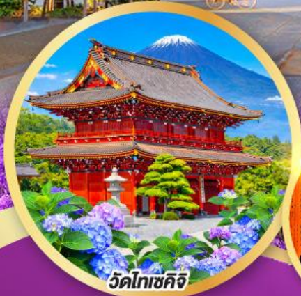
วัดโทเซคิจิ