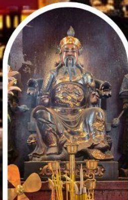
วัดปักไต้ เสริมโชคกลางนำความรุ่งเรืองทุกด้านของชีวิต