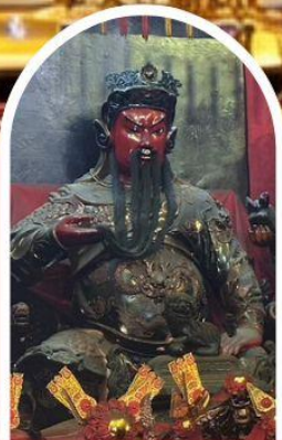
วัดกวนไท่ ขอเทพเจ้ากวนอู ความซื่อสัตย์ เงินทอง ธุรกิจมั่นคง