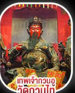
เทพเจ้ากวนอู วัดกวนไท