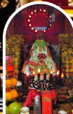
วัดเจ้าแม่กวนอิมอ่องฮำ ขอพรเรื่องเงิน ทรัพย์สิน และความมั่งคั่ง