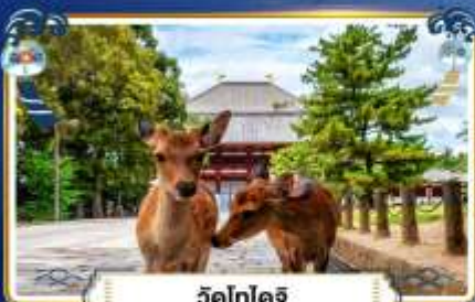
วัดโทไดจิ