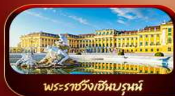
พระราชวังเซินบรูน์