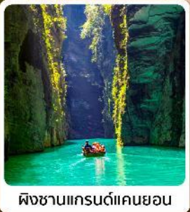
ผิงซานแกรนด์แคนยอน

ไฮไลท์! ปืนตรงลงเอ็นชิว ที่ยิวเอ็นชิวเน้นๆจัดเต็มทั่วเมือง หุบเขาสิงโต ผิงซานแกรนด์แคนยอน อุทยานจิ้นลี่ซาน