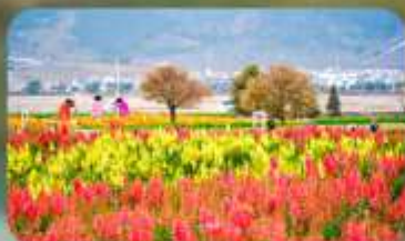
สวนดอกไม้ฮวาอวี๋มู่ฉาง