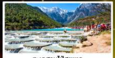
ทะเลสาบไป๋สุยเหอ