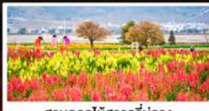
สวนดอกไม้ฮวงอวี่มู่ฉาง