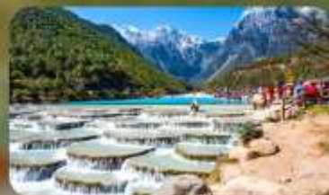
ทะเลสาบไป๋สุยเหอ