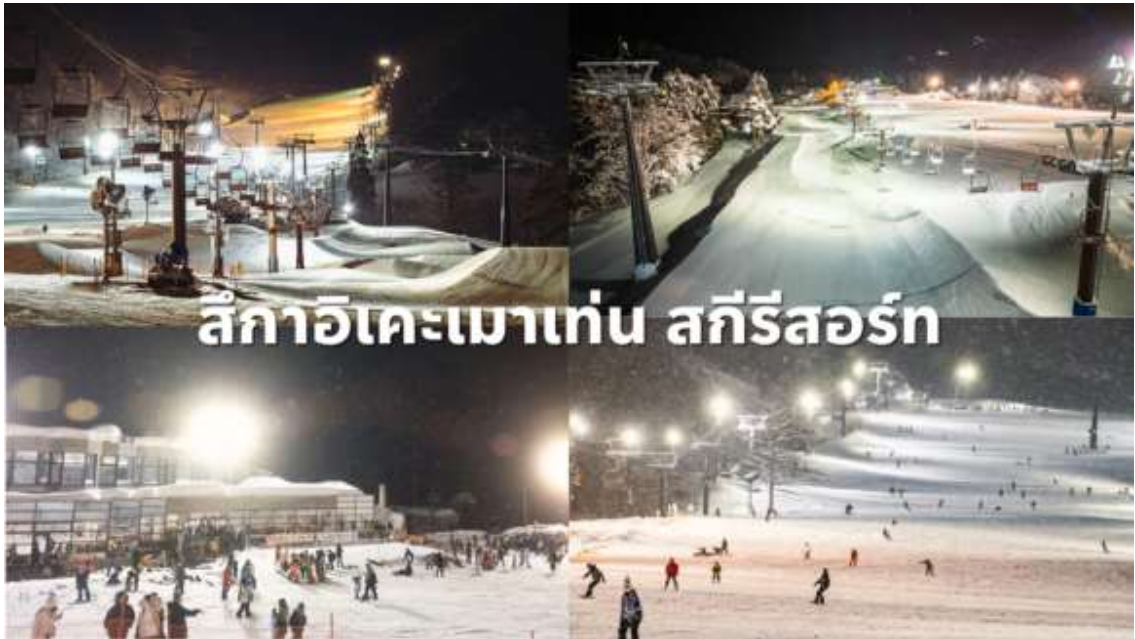
4 : ฮาคูบะอิวาทาเกะรีสอร์ท ลานสกีที่มีระดับความสูง 750-1289 เมตร รวมระยะทางวิ่งของ ลานสกีไกลสุดกว่า 3,800 เมตร ทางฮาคูบะอิวาทาเกะรีสอร์ท บริการด้วยลิฟต์ 7 ตัวและกระเช้า 1 ตัวครอบคลุม 26 คอร์ส