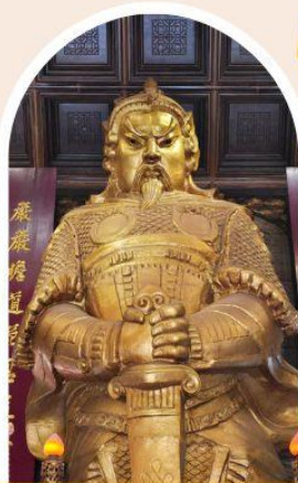
วัดแซกง ขอพรโชคลาภ การเงิน และธุรกิจ