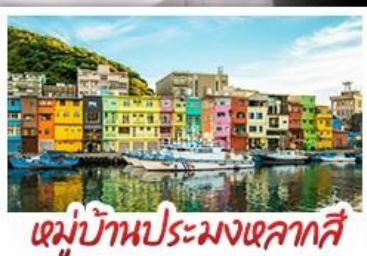
หมู่บ้านประมงเหลากสี