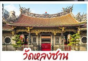
วัดเจหลงซาน