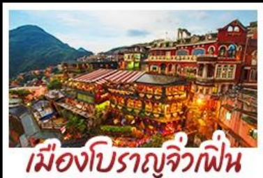
เมืองโบราณจิวเฟิน

เที่ยวธรรมชาติระดับโลก เอเชีย ทะเลสาบสุริยันจันทรา - เมืองดงครบ ไทเป จิวเฟิน - ซีเหมินติง