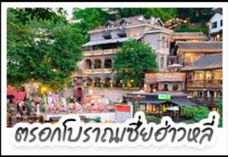
ตรอกโบราณเขี่ยฮ่าวหลี่