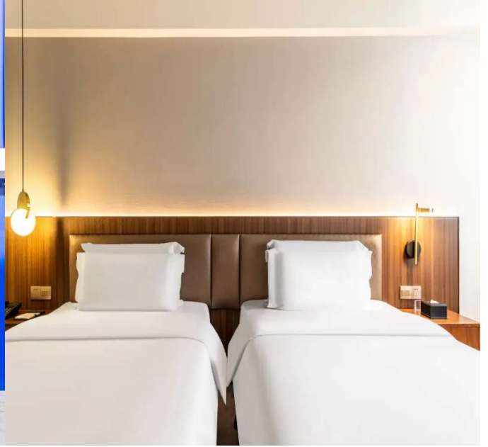
โรงแรมใจกลางย่านช้อปปิ้งชุนซีลู่