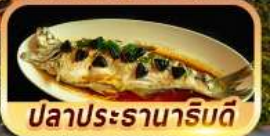
ปลาประรานาธิบดี