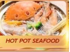
HOT POT SEAFOOD