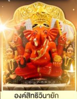
องค์สิทธีวินายก