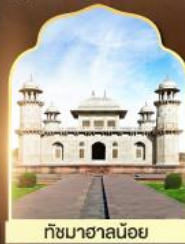
ถ้ำมาฮาลีนอย