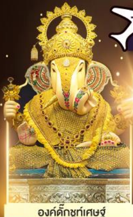
องค์ดีกษุท์เศษฐ์