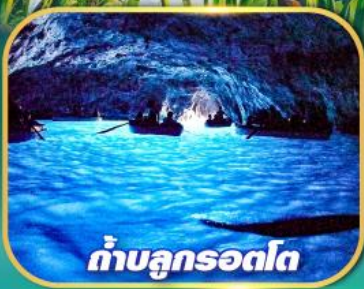
ถ้ำบลูกรอตโต