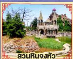
สวนหินงิ้วหวู่