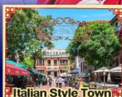
Italian Style Town