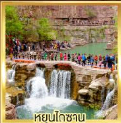
หยุ่นโกซาน