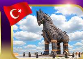
ม้าไม้เมืองกรอย ซานคาลา