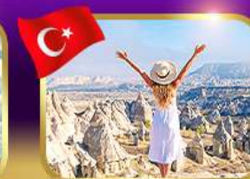
ชมความงาม หุบเขาแห่งรัก