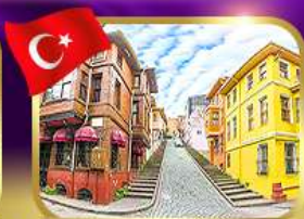
ชมบ้านหลากสีย่านบาลีก