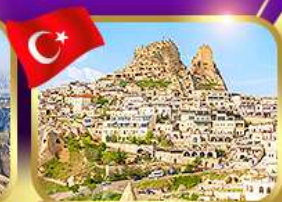
หุบเขาอูซซาร์ คัปปาโดเกีย