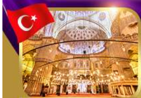
เข้าชมความงามสุเหร่าสีน้ำเงิน