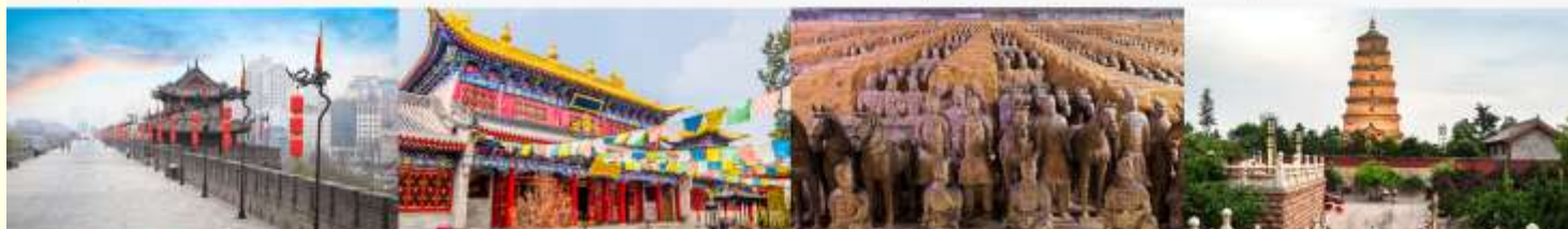
กำแพงเมืองโบราณ