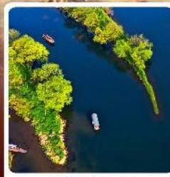
อ่าวพระจันทร์

• ไอลาร์ เชียงอิน ลั่วซิงตุน หอคอยดาวตงแห่งเจียงซี คุบเขาวังเซียนกู่ ดินแดนสวยดุจเทพนิยาย