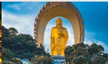
พระใหญ่ตงหลิน