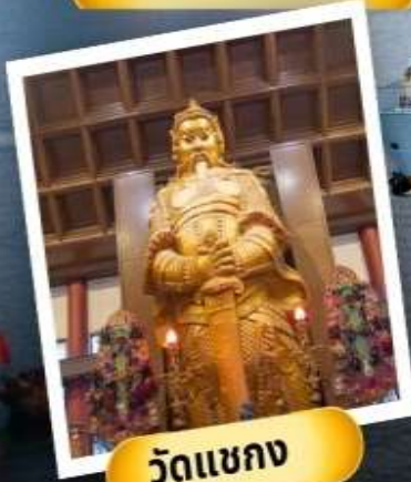
วัดเขากง