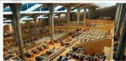
ห้องสมุดอเล็กซานเดรีย