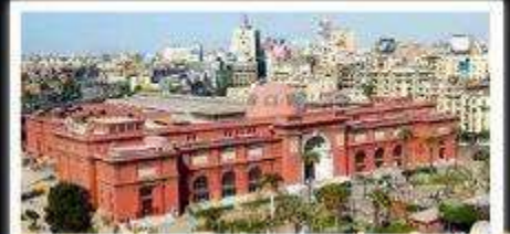
พิพิธภัณฑ์สถานแห่งชาติอียิปต์