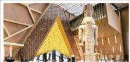
พิพิธภัณฑ์แกรนด์อียิปต์(GEM)

อารยธรรมลุ่มแม่น้ำไนล์ - พีรามิด - อเล็กซานเดรีย - เมมฟิส - ไคโร - โรงแรมระดับ 4 ดาว รวมค่าวีซ่า ตะลุยกะเลทราย - อาหารครบทุกมื้อ