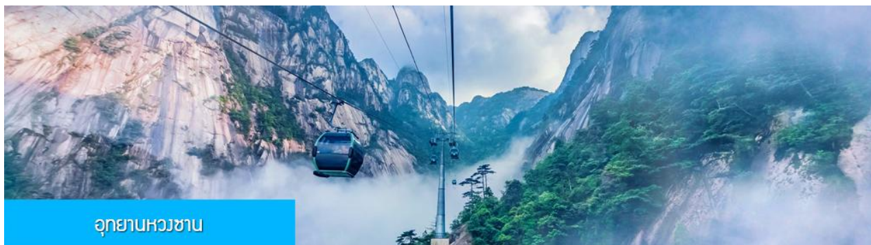
อุทยานหวงซาน