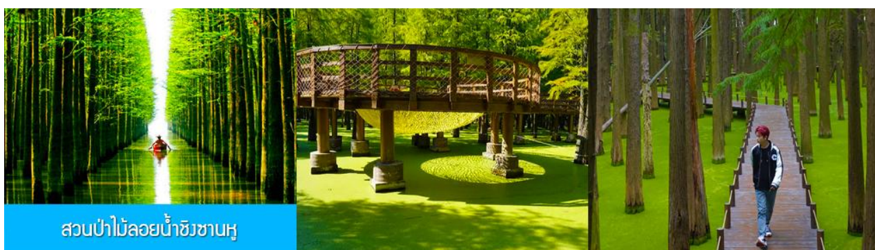
สวนป่าไผ่ลอยน้ำชิงชานหู

พักที่ PAIJING HOLIDAY HOTEL โรงแรมระดับ 4 ดาวท้องถิ่น หรือเทียบเท่า เมืองหวงซาน