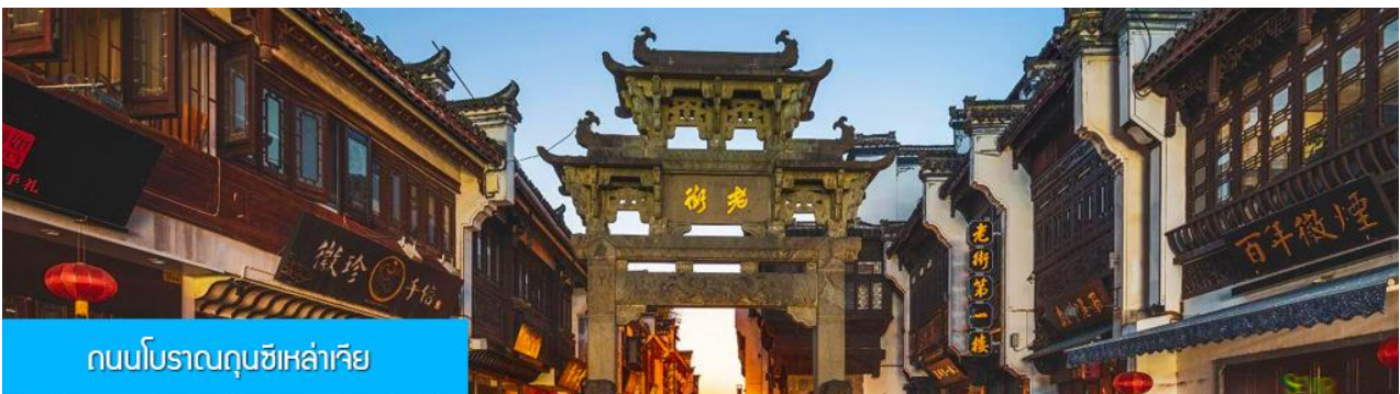
ถนนโบราณถุนซีเหล่าเจีย

หลังอาหารนำท่านเที่ยวชม หมู่บ้านโบราณหงซุน 宏村 หมู่บ้านโบราณจีนชื่ออายุกว่า 800 ปีที่ได้รับการขึ้น ทะเบียนเป็นมรดกโลกทางวัฒนธรรมจาก UNESCO ชมบ้านเรือนโบราณที่ถูกสร้างขึ้นในยุคราชวงศ์หมิง และ ราชวงศ์ชิงที่ยังคงสภาพที่สมบูรณ์กว่า 140 หลัง นำท่านเที่ยวชมตามจุดเช็คอินขึ้นชื่อภายในหมู่บ้าน อาทิ บึงน้ำ พระจันทร์ ทะเลสาบหนานหู โรงเรียนหนานหู หอบรรพบุรุษ คลองน้ำหงซุน ต้นไม้โบราณ ฯลฯ จากนั้นนำท่านเดินทางสู่เมือง หวงซาน (ระยะทาง 70 กม. ใช้เวลาเดินทางราว 1 ชั่วโมง)