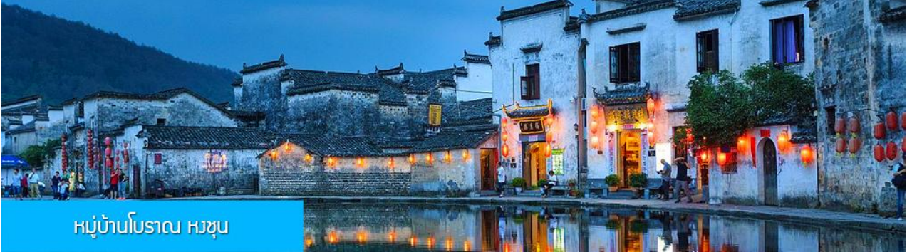
หมู่บ้านโบราณ หงซุน

พักที่ โรงแรม JIANGNAN HAOTING HOTEL ระดับ 4 ดาวท้องถิ่นหรือเทียบเท่าในเมืองซ่งเหรา