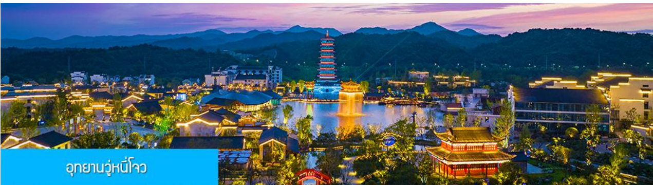
อุทยานวู่หนี่โจว

หลังอาหารนำท่านนั่งกระเช้าลงจากหมู่บ้านหวงหลิ่ง นำท่านขึ้นรถบัสเดินทางสู่อุทยานวู่หนี่โจว