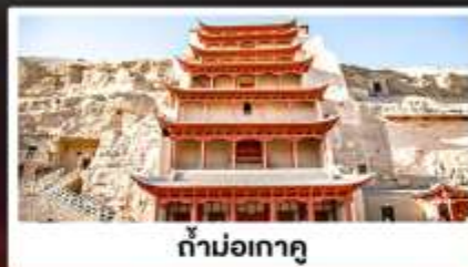
ถ้ำม่อเกาตุ