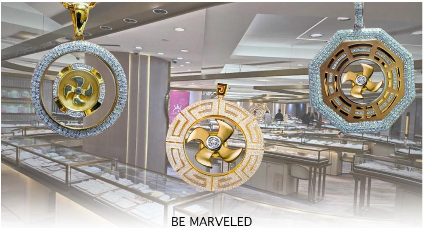
BE MARVELED ศูนย์ฮวงจุ้ย กังหันเศรษฐี

นำท่านชม ศูนย์ฮวงจุ้ย กังหันเศรษฐี ที่ขึ้นชื่อของฮ่องกง ท่านจะได้พบกับงานดีไซน์ที่ได้รับรางวัลยอดเยี่ยม และใช้ในการเสริมดวงเรื่องฮวงจุ้ย โดยการย่อใบพัดของกังหันที่เป็นสัญลักษณ์ของวัตต์แดงหงมิว มาทำเป็นเครื่องประดับ ไม่ว่าจะเป็นจี้, แหวน, กำไล หรือต่างหูเพื่อเป็นเครื่องประดับติดตัว และเสริมดวงชะตา ซึ่งสินค้าทุกชิ้นนี้ มีเอกสาร รับประกันคุณภาพเปลี่ยนหรือ ซ่อม ได้ตลอดอายุการใช้งาน หากเกิดการชำรุดจากสินค้าไม่ใช่อุบัติเหตุ