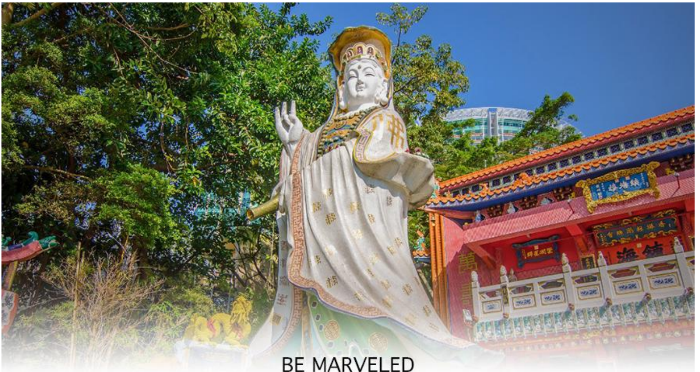
BE MARVELED วัดเจ้าแม่กวนอิมรีพัลส์เบย์

จากนั้นนำท่านเดินทางสู่ ชายหาดรีพัลส์ เบย์ (REPULSE BAY) หาดทรายรูปจันทร์เสี้ยวแห่งนี้เป็นหาดที่สวยงามที่สุดแห่งหนึ่งในฮ่องกง และยังใช้เป็นฉากในการถ่ายทำภาพยนตร์หลายเรื่อง ถือเป็นแหล่งท่องเที่ยวยอดนิยมในหมู่ชาวฮ่องกง นักท่องเที่ยวนิยมมาสักการะที่ วัดทินฮั่ว อ่าวรีพัลส์เบย์ (TIN HAU TEMPLE REPULSE BAY) ซึ่งตั้งอยู่ริมทะเล เป็นสถานที่ท่องเที่ยวที่สำคัญ สร้างขึ้นในปี ค.ศ.1993 มีรูปปั้นของ เจ้าแม่กวนอิม ปางประทานพรตั้งอยู่ ซึ่งคนฮ่องกงและคนจีนให้ความเคารพนับถือมากที่สุด เชื่อว่าเป็นเทพที่มีความศักดิ์มากขอพรเรื่องงานการเงิน และขอพรขอโชคลาภเพื่อเป็นสิริมงคลและขอพร