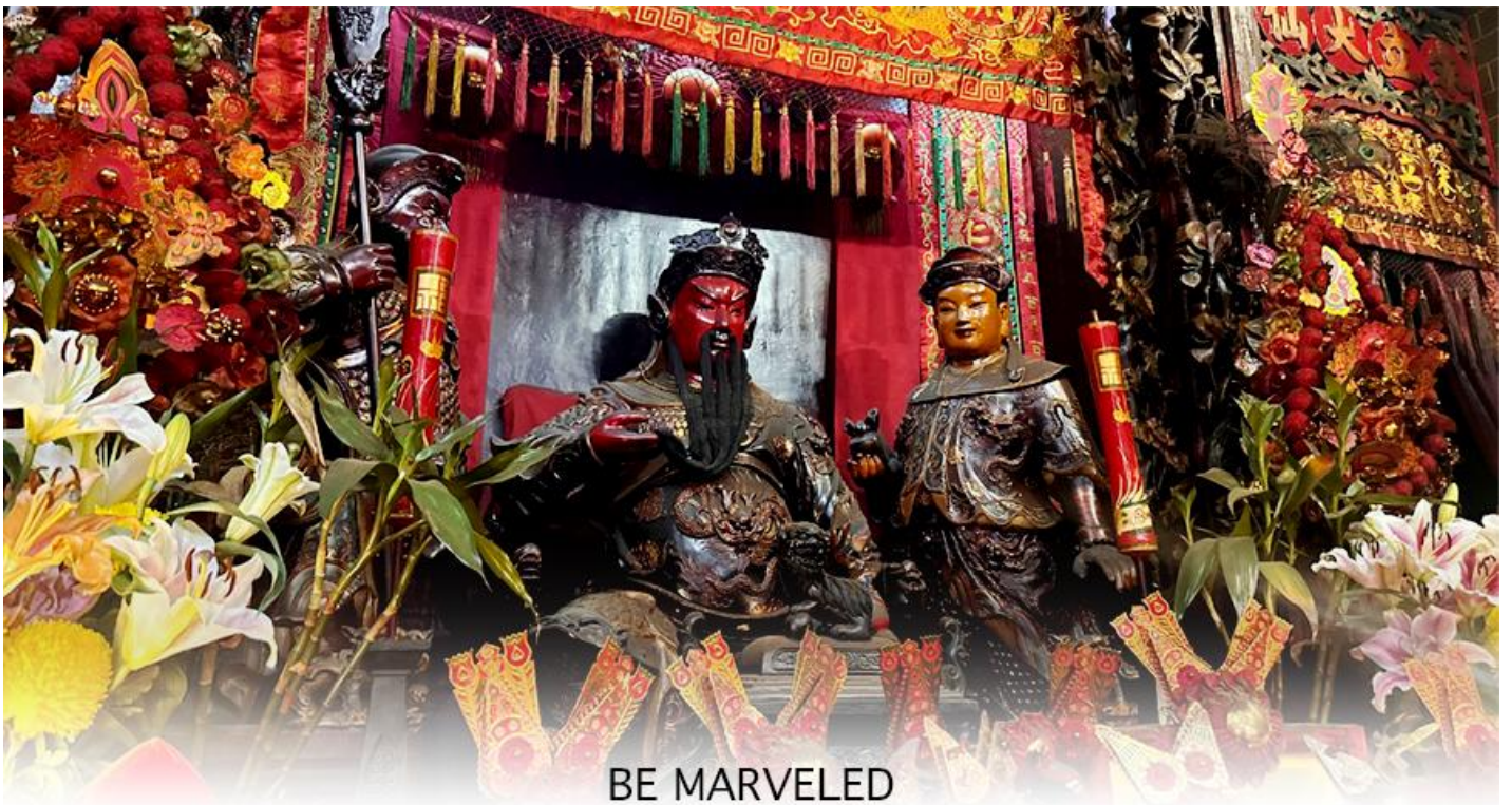
BE MARVELED วัดกวนอู

เจ้าแม่ทับทิม หรือ เทพธิดาแห่งท้องทะเล ซึ่งทำหน้าที่ปกป้องคุ้มครองชาวประมง ตั้งโดดเด่นอยู่ท่ามกลางสวนสวยที่ทอดยาวลงสู่ชายหาดให้ท่านนมัสการขอ และนำท่านเดินข้าม สะพานต่ออายุ ซึ่งเชื่อกันว่าข้ามหนึ่งครั้งจะมีอายุเพิ่มขึ้น 3 ถ้าข้ามแล้วห้ามเดินย้อนกลับไปเด็ดขาด เพราะคนฮ่องกงเชื่อว่าชีวิตจะสั้นลงไป 3 ปี สำหรับคนโสดจะนิยมขอพรกับ เทพเจ้าแห่งความรัก ให้เอามือลูบที่บริเวณหินสีดำ พร้อมกับอธิษฐานให้สมหวังกับความรัก ปิดท้ายด้วยการรับพลังฮวงจุ้ยจาก ศาลา แปกทิส ซึ่งถือเป็นจุดรวมรับพลัง ถือเป็นจุดที่มีฮวงจุ้ยดีที่สุดในเกาะฮ่องกง และยังมีรูปปั้นองค์เทพอีกมากมายภายในวัดแห่งนี้ให้กราบไหว้ขอพร