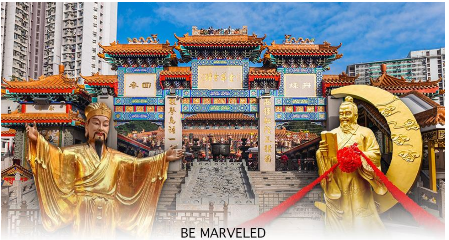
BE MARVELED วัดหวังต้าเซียน

จะพบรูปปั้นเจ้าบ่าว อยู่ทางขวา และรูปปั้นเจ้าสาวอยู่ทางซ้าย โดยมีด้ายแดงผูกโยงจากเจ้าบ่าวและเจ้าสาวมาที่เทพหยุกโหลว ซึ่งท่านจะคอยทำหน้าที่จดรายชื่อกู้รัก เชื่อกันว่าสมมุติผู้เต่าถือในมือ คือบัญชีรายชื่อกู้รักที่จะได้รับคำอวยพรให้อยู่คู่กันอย่างร่มเย็นเป็นสุข ซึ่งจะปรากฏตัวยามค่ำคืนภายใต้แสงจันทร์ เป็นเทพเจ้าผู้เป็นอมตะที่อาศัยอยู่บนดวงจันทร์ และลงมาโลกมนุษย์ เพื่อผูกด้ายดวงชะตา ระหว่างคู่รักซึ่งเมื่อคู่กันแล้วก็จะไม่แคล้วคลาดกัน และมีความรักที่มั่นคงและยืนยาว