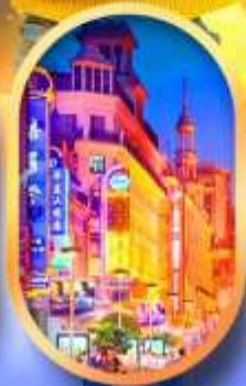
ถนนหนานกิง