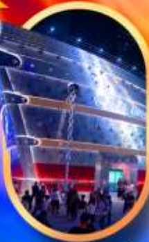
เรือเดอะหลุยส์