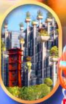
อาคาร 1,000 คัดไม้