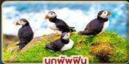
นกพิงฟิน

📅 เดินทาง : 30 เม.ย. - 07 พ.ค. | 23-30 ก.ค. 69