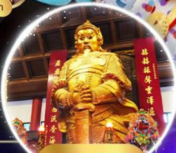
วัดแซงหมิว