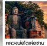
หลวงพ่อดเล่ซ่าน