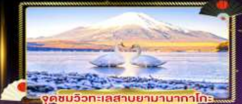
จุดชมวิวกะเลสาบยามานากาโกะ