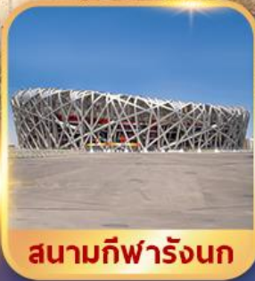
สนามกีฬาธันก