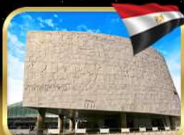
ห้องสมุดอเล็กซานเดรีย