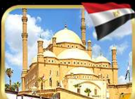
มัสยิดโอบอิมมัดอาลี