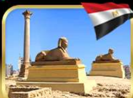
เสาสีมันปอมเปย์