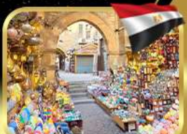
ตลาดชานเอลคาลิลี