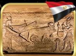
สุสานใต้ดินอเล็กซานเดรีย

เข้าชมพิพิธภัณฑ์อียิปต์แห่งใหม่ (GRAND EGYPTIAN MUSEUM)