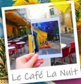
Le Café La Nuit