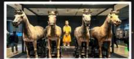
สุสานทหารจีนซี