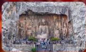
ถ้ำผาหลงเหมิน