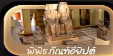
พิพิธภัณฑ์อียิปต์

✂️ อาหาร 9 มื้อ + บนเครื่อง + 🏨 ที่พักโรงแรมดี 4 ดาว + 🍷 บริการน้ำดื่ม 5 วัน: 2 ขวด + 📶 ฟรีอินเทอร์เน็ต Universal