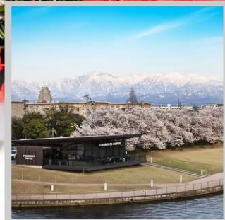
“TOYAMA KANSUI PARK”