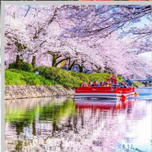
“MATSUKAWA RIVER BOAT”