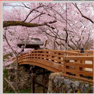
“TAKATO CASTLE RUINS”