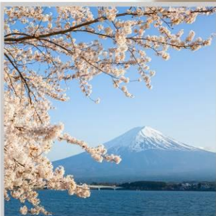
“LAKE KAWAGUCHIKO SAKURA”