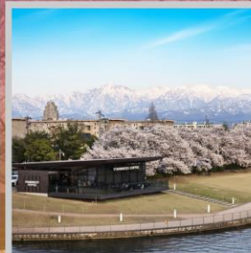
"TOYAMA KANSUI PARK"