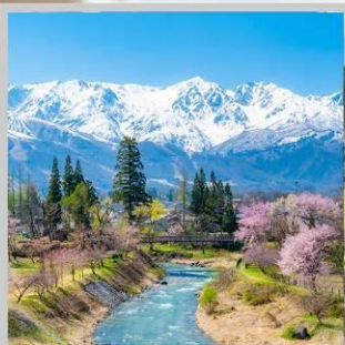
“HAKUBA OIDE PARK”