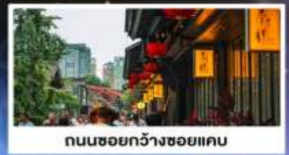
ถนนชอยกว้างชอยแคบ