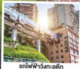
รถไฟฟ้าวิ่งทะลุคิก