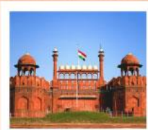
♥♥♥ Agra Fort