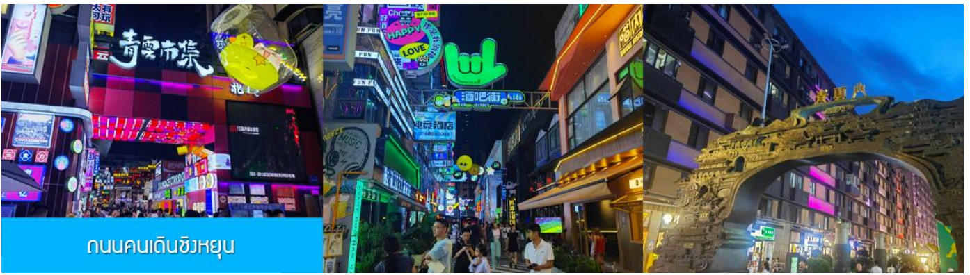
ถนนคนเดินชิงหยุน

เย็น บริการอาหารเย็น ณ ภัตตาคาร(มื่อที่ 9) หลังอาหารนำท่านเที่ยว ถนนคนเดินชิงหยุน 青云市集 เป็นย่านการค้าโบราณที่ถูกพัฒนาเป็นแหล่งรวมร้านค้าและสตรีทฟู้ดที่คึกคักใจกลางเมืองกุ้ยหยาง ให้ท่านเพลิดเพลินกับการเดินชมหรือเลือกซื้อสินค้าพื้นเมืองในย่านการค้าที่คึกคักแห่งนี้ พักที่ HOLIDAY INN HOTEL ระดับ 4 ดาวท้องถิ่นหรือเทียบเท่าในเมืองกุ้ยหยาง