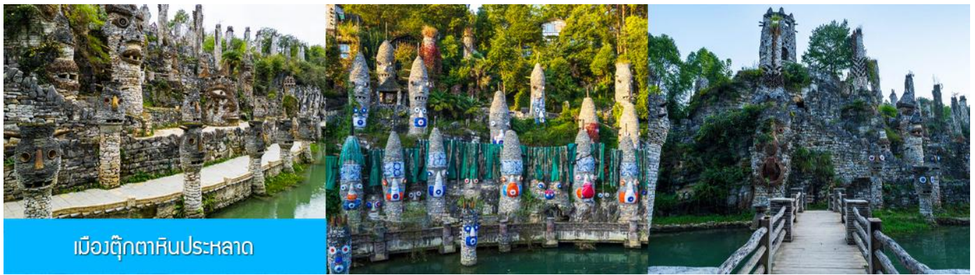
เมืองตุ๊กตาหินประหลาด