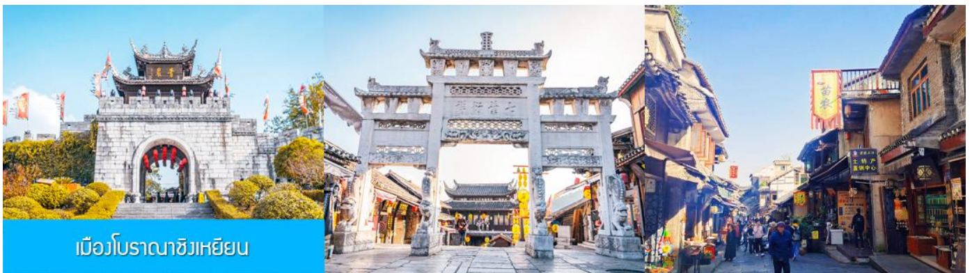
เมืองโบราณชิงเหยียน