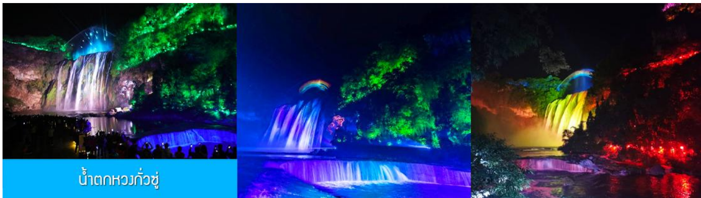
น้ำตกหวงกั๋วชู่

หลังอาหารนำท่านเที่ยวชม น้ำตกหวงกั๋วชู่ 黄果树瀑布 แหล่งท่องเที่ยวขึ้นชื่อระดับ 5A ที่ถือเป็นสัญลักษณ์ของมณฑลกุ้ยโจว เป็นหมู่ น้ำตกที่ประกอบด้วยน้ำตกน้อยใหญ่กว่าสิบแห่ง โดยมีน้ำตกหวงกั๋วชู่เป็นน้ำตกขนาดใหญ่ที่มีความสูง 74 เมตร กว้าง 81 เมตร เป็นน้ำตกหลักของอุทยาน ชมความสวยงามของน้ำตกที่ประดับด้วยแสงสีและเลเซอร์ยามค่ำคืน ที่แต่งแต้มความมหัศจรรย์แก่อุทยานแห่งนี้ (ค่าทัวร์รวมค่ารถรับส่ง รวมค่าบันไดเลื่อนขาลง และขาขึ้นภายในอุทยาน)