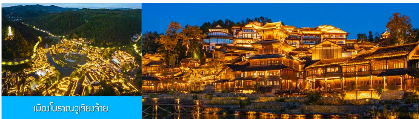
เมืองโบราณวูเจียงจ้าย

หลังอาหารนำท่านเที่ยวชม เมืองโบราณวูเจียงจ้าย 乌江寨景区 เป็นอุทยานท่องเที่ยวริมเมืองโบราณชนเผ่าเหมียว (ชนเผ่าม้ง) ที่ได้ชื่อว่ามีวิวกลางคืนที่สวยงามที่สุดของมณฑลกุ้ยโจว อุทยานนี้รวมไว้ซึ่งแหล่งท่องเที่ยว สถานที่ถ่ายทำภาพยนตร์ ร้านอาหาร รีสอร์ท ศูนย์ประชุม ด้วยทุนสร้างกว่าหมื่นล้านหยวน สัมผัสบ้านเรือนโบราณของชนเผ่าเหมียว ซึ่งเป็นชนกลุ่มหลักที่พำนักในพื้นที่มานาน ปัจจุบันชนเผ่าเหมียวยังคงรักษาไว้ซึ่งขนบธรรมเนียมและวิถีชีวิตแบบดั้งเดิม ชมการแสดงพื้นเมือง และการละเล่นพื้นเมืองของชนกลุ่มน้อยต่างๆ ในช่วงหัวค่ำบ้านทุกหลังในอุทยานจะประดับด้วยแสงไฟที่งดงาม และมีการแสดงต่าง ๆ อาทิ การบิน โดรน น้ำพุ และการยิงแสงเลเซอร์ ฯลฯ (ค่าทัวร์รวมค่ารถรับส่งภายในเขตอุทยาน ค่าทัวร์ไม่รวมค่านั่งเรือแจวในเขตอุทยาน)