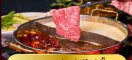
ชาบูหม่าล่าไม่อัน