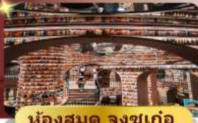
ห้องสมุด จงซูเก้อ