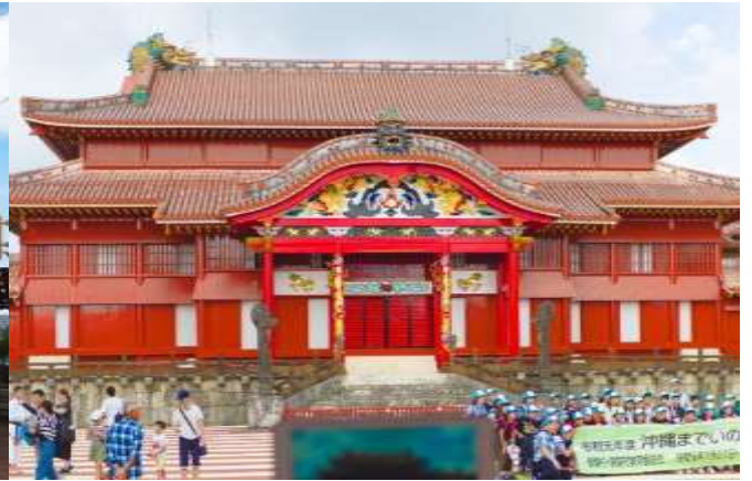
Shurijo Castle (external facade)