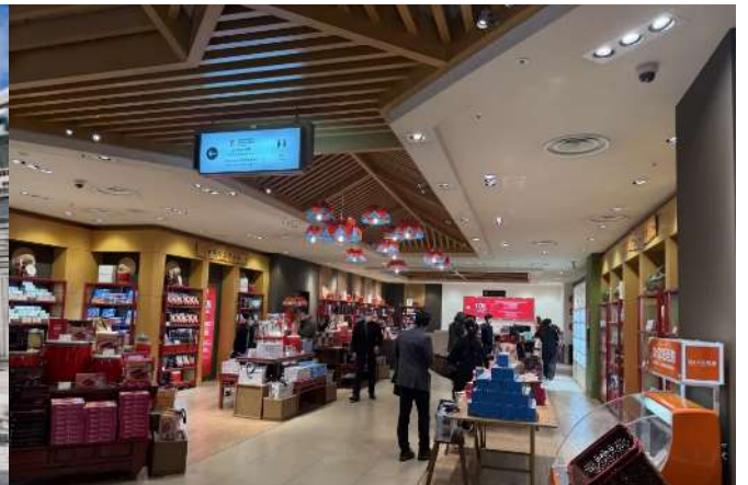
Japan Tax Free Shop

คำ อีสระรับประทานอาหารค่ำตามอัธยาศัย ณ ห้องอาหารที่เรือจัดเตรียมไว้