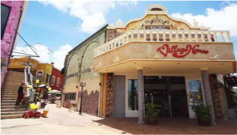
Mihama American Village