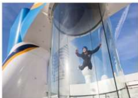
RIPCORD® BY IFLY®